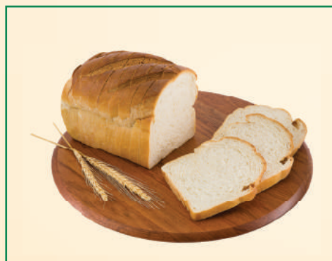
7283 PÃO ITALIANO