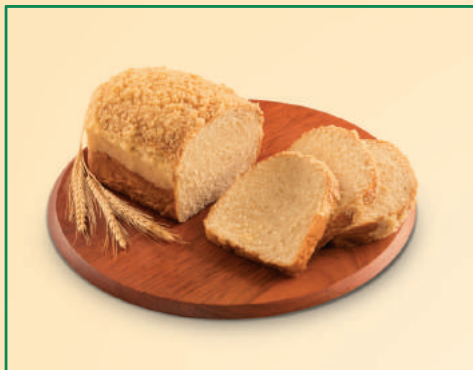
3186 / 2561 CUCA SIMPLES 200G / 400G