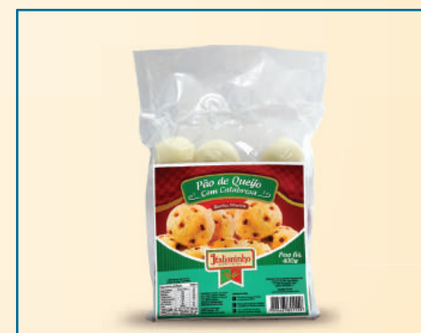
109064 PÃO DE QUEIJO COM CALABRESA