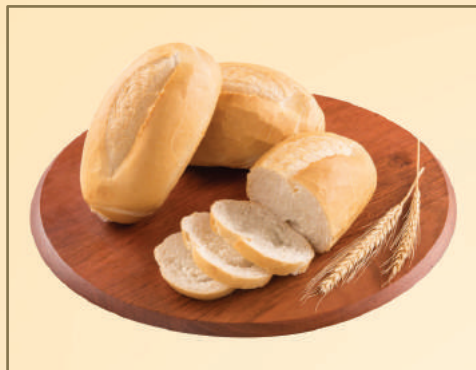
2707 / 2721 / 3247 PÃO FRANCÊS DIURNO / NOTURNO / MINI