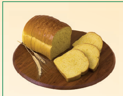
7269 PÃO DE CENOURA