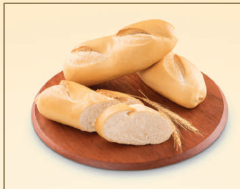
3223 PÃO FRANCÊS MINI BAGUETTI