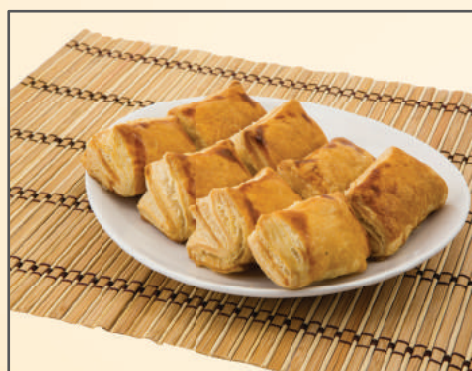
2776 / 3131 / 2813 / 3155 PASTEL FOLHADO DE CARNE P / G PASTEL FOLHADO DE FRANGO P / G