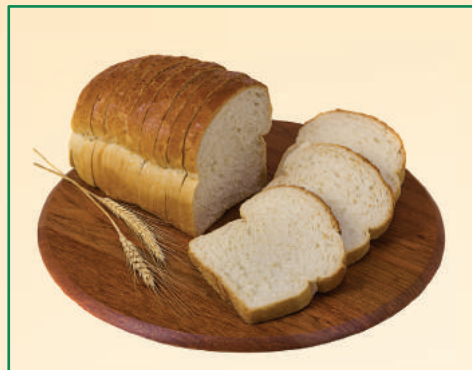
7306 PÃO DE AIPIM