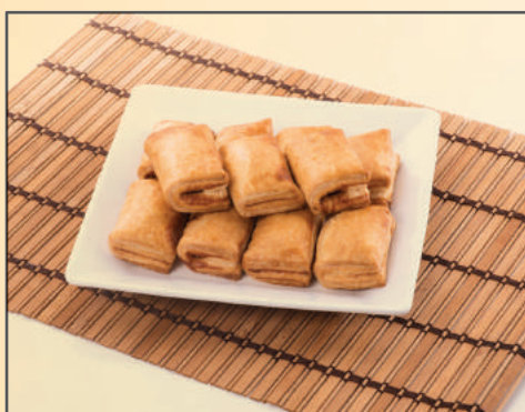
4765 / 4766 PASTEL DE NATA DE CHOCOLATE / GOIABADA