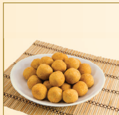
3056 / 8908 / 8914 / 2325 BOLINHA DE CHOCOLATE / PEIXE / PALMITO / QUEIJO COM REQUEIJÃO