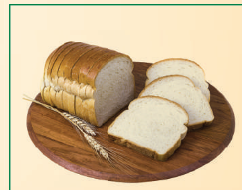
13604 PÃO SEM AÇÚCAR