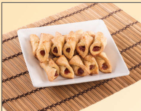
4763 BISCOITO LENCINHO