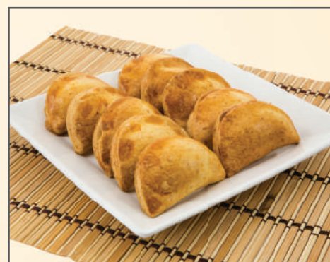
10079 / 10081 / 10078 / 10080 / 10030 PASTEL DE FORNO DE CARNE P / G PASTEL DE FORNO DE FRANGO P / G PASTEL INTEGRAL DE FRANGO P