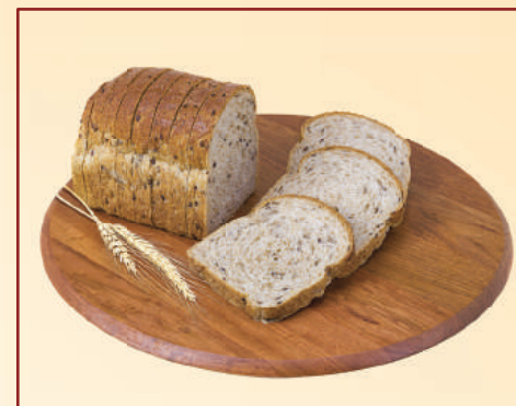
6644 PÃO INTEGRAL COM LINHAÇA