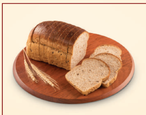
6682 PÃO 7 GRÃOS