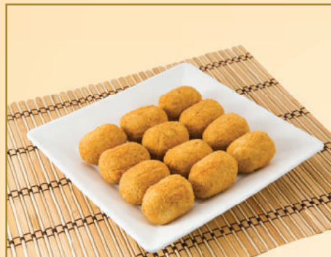
3070 / 2547 CROQUETE DE CALABRESA / CARNE