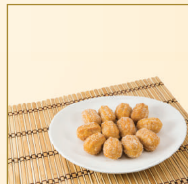
8792 CHURROS DE DOCE DE LEITE