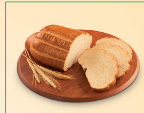
14601 PÃO DE MELÃO