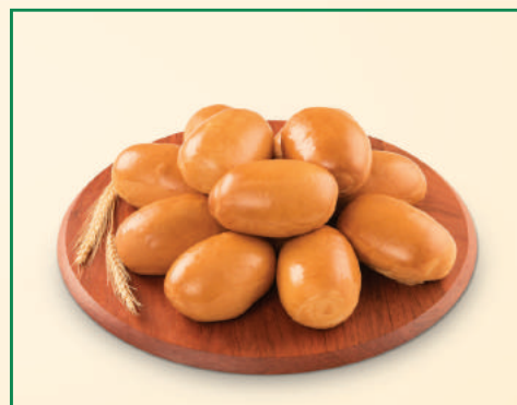
2660 / 2684 PÃO DE ERVA DOCE / FOFINHO