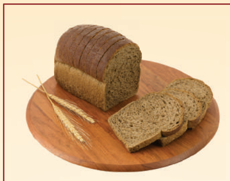
6743 PÃO PRETO