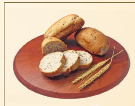
6934 PÃO INTEGRALZINHO COM LINHAÇA