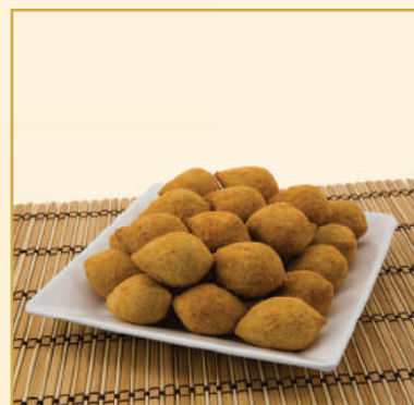
2424 / 2425 COXINHA DE FRANGO P / G