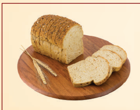
6729 PÃO MULTIGRANO