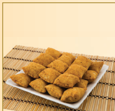
13680 TRAVESSEIRINHO DE MILHO/ REQUEIJÃO