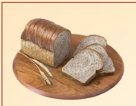
6705 PÃO DE CENTEIO