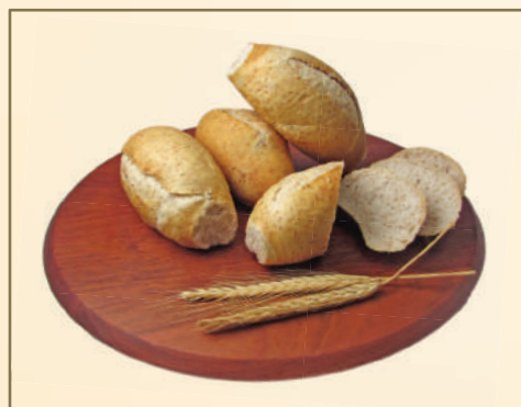
2709 PÃO FRANCÊS COM FIBRAS