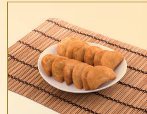
2936 / 2950 RISOLES DE CARNE / FRANGO