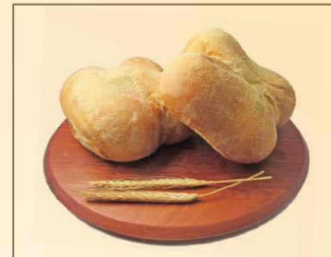
3209 PÃO FRANCÊS BILHA