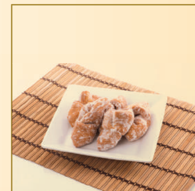
2400 CALÇA VIRADA