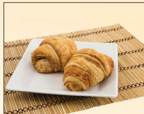
2523 CROISSANT SIMPLES