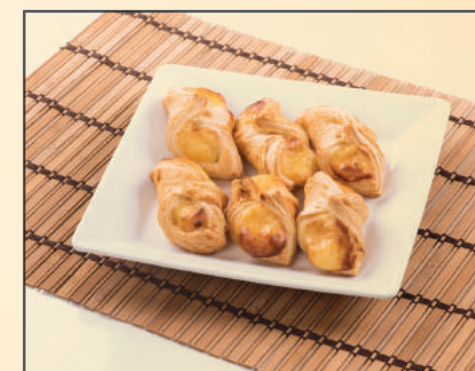
3391 PASTEL SANTA CLARA