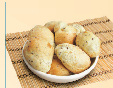
7341 PÃO DE QUEIJO MINEIRO MULTIGRANO