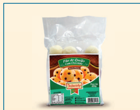
109063 PÃO DE QUEIJO COM CHOCOLATE