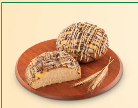
2646 PÃO DOCE