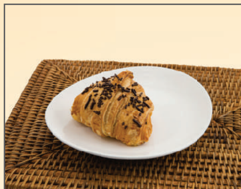
2462 / 2486 / 2469 CROISSANT DE CHOCOLATE / GOIABADA / MORANGO