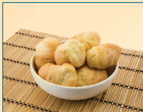
7337 PÃO DE QUEIJO MINEIRO