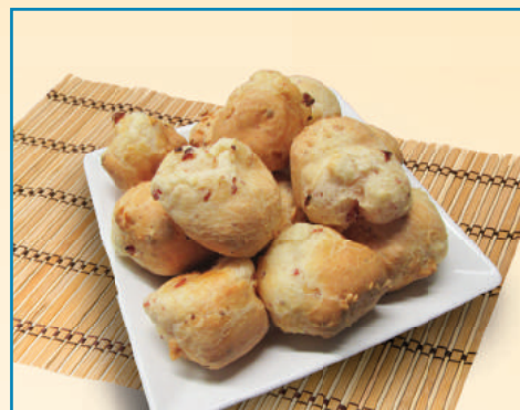
7338 PÃO DE QUEIJO MINEIRO COM CALABRESA