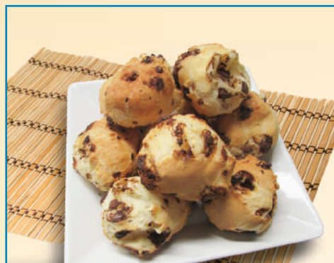
7339 PÃO DE QUEIJO MINEIRO COM CHOCOLATE