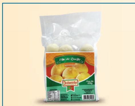
109062 PÃO DE QUEIJO MINEIRO