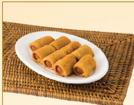
5197 ENROLADINHO DE SALSICHA