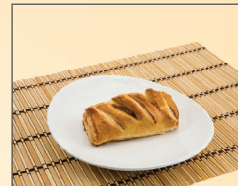
11273 MINI STRUDELL DE MAÇÃ