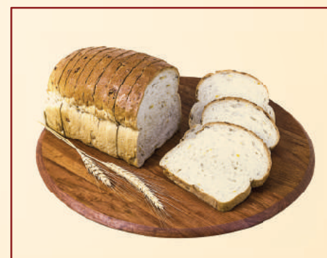
13758 PÃO DE SOJA/GIRASSOL